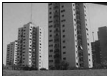
Torres en blanco y negro.