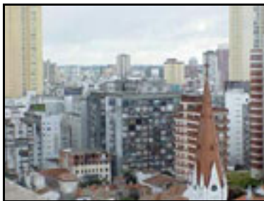
La ciudad enmarcada.

Decíamos que "como auténtico y autoproclamado Vidente, Rimbaud presenta a la vez la ciudad del desencanto y la ciudad futura del deseo: la "metrópolis que se supone moderna" , donde "millones de personas que no tienen necesidad de conocerse sobrellevan de manera tan semejante la educación, el oficio y la vejez" , y aquella donde es "imposible expresar la claridad producida por el cielo inmutablemente gris, el resplandor imperial de las mamposterías, y la nieve eterna del suelo" . Hubo, por suerte, respuestas de nuestros amigos. Guillermo de Diego, por ejemplo, nos envió imágenes de su ciudad, Mar del Plata: